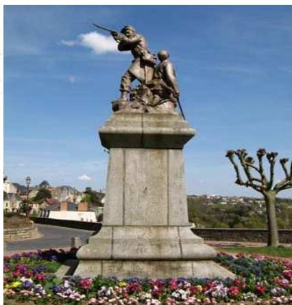
Thouars (Deux-Sèvres) : monument commémoratif de la guerre de 1870-71