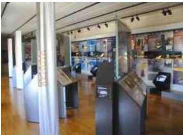
Exposition permanente du Centre Régional "Résistance & Liberté"