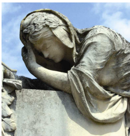
Chabonais (Charente) : détail du monument (bonnet phrygien et couronne végétale couvert d'un voile de veuve)