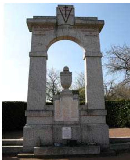
Lageon (Deux-Sèvres) : mémorial dédié aux « déportés-résistants des arrondissements de Bressuire et de Parthenay morts pour la France »