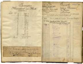
Souscription publique pour l'érection du monument commémoratif de la guerre 1914-18 - Thouars - 1923

visites encadrées par un médiateur culturel du service éducatif